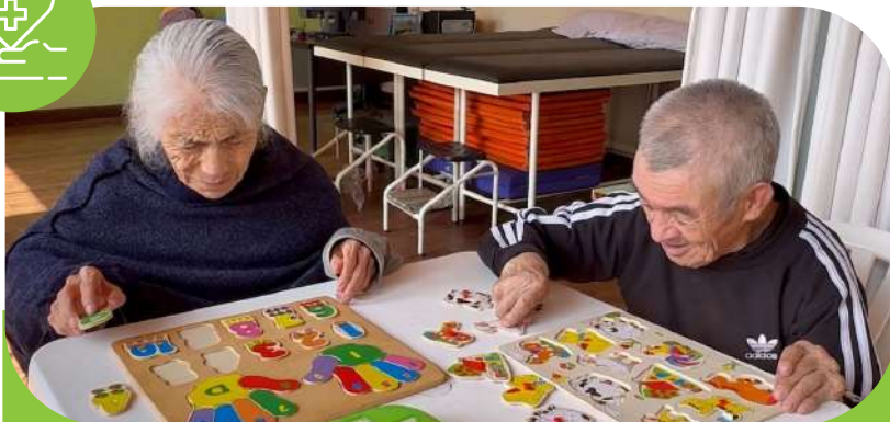
✦ Rehabilitación y bienestar físico y mental