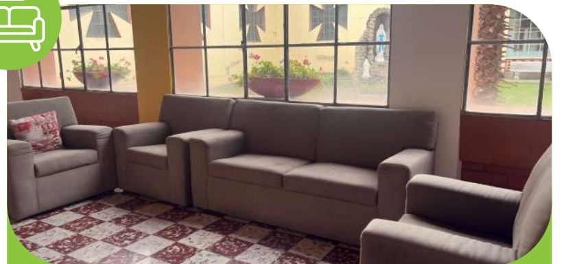
✦ Convivencia y entretenimiento