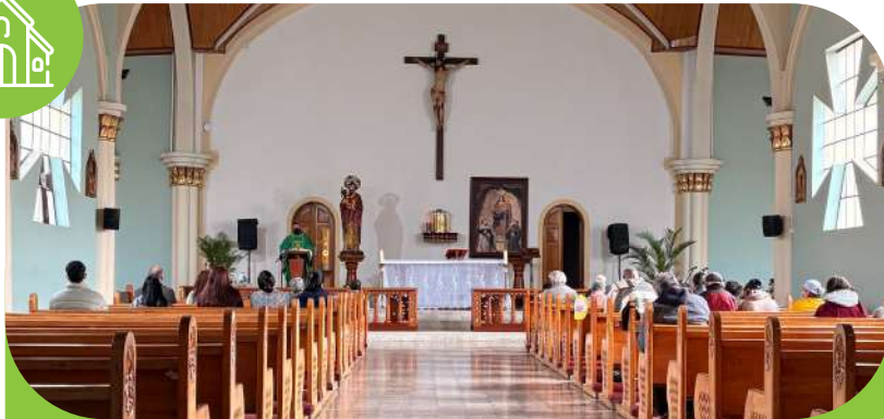
✦ Espacios de paz y escucha