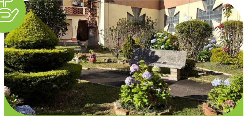
✦ Espacios de aire libre